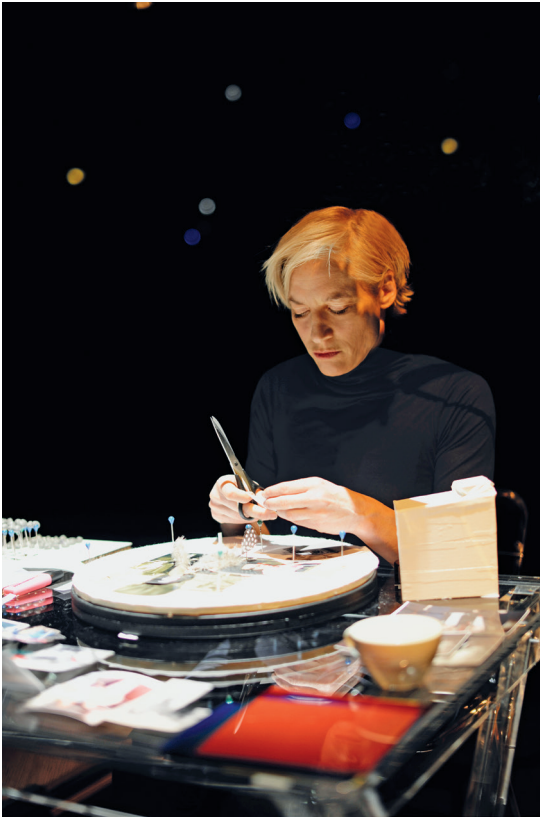
Abb. 1 Meg Stuart / Damaged Goods : Hunter , 2014.

Nach rund einer halben Stunde schleppt Stuart dann auch ganz handfeste Projektionsflächen in Form von Plexiglasplatten mit sich auf die Bühne. Durch Überblendungen, unterschiedliche Lichtgebungen, farbliche Hintergründe und andere Projektionstechniken lassen diese die Protagonistin, ihren Körper, ihre Gestalt und ihre Schatten verschiedenartig – mal diffus mal klar konturiert – erscheinen. 19 Alles wird dabei mit Allem überblendet; Materielles, Konkretes mit Projiziertem, Übertragenem. Die physisch anwesende Akteurin spielt hier quasi vor Zeugen mit Gegensätzen, die – so würde ich behaupten – die verkörperte Auto-Bio-Graphie ebenso wie überhaupt viele Geschichten unserer Gegenwart ausmachen: mit Sein und Schein, mit Fakten und Fiktionen, mit Authentizität und Virtualität. All dies kristallisiert sich in einem performenden